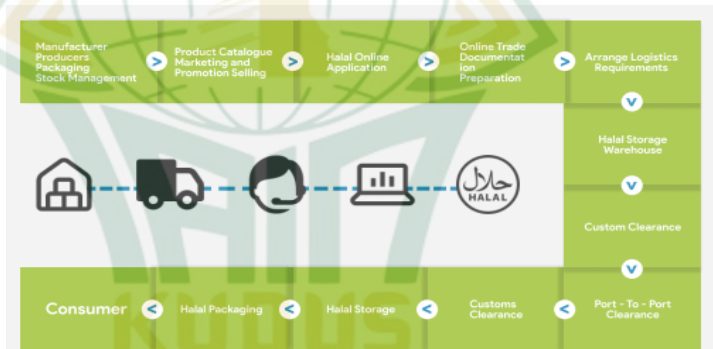
Gambar 2.1 Rantai Pasok Halal

Prof. Dr. Marco Tieman membagi tingkat kehalalan suatu produk menjadi dua. Yang pertama, halal yang diperoleh masyarakat sebagai end product (produk akhir), yang dapat ditemukan di pasar, mal, dan toko retail. Konsumen dapat menentukan apakah suatu produk halal melalui logo sertifikasi yang disediakan oleh lembaga yang berwenang seperti Badan Penyelenggara Jaminan Produk Halal (BPJPH). Yang kedua, halal yang didapatkan dari proses produk rantai pasokan halal yang dikenal sebagai “ from farm to fork ” (dari bibit sampai dengan di meja restoran) proses ini memastikan bahwa setiap langkah mulai dari manufaktur, pengemasan, transportasi logistic, dan bahkan pengangkutan wadah harus halal dan tidak terkontaminasi dengan produk tidak halal. 54