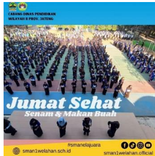
Gambar 4.8 Dokumentasi Kegiatan Jumat Sehat

Meskipun peneliti tidak bisa mengobservasi kegiatan jumat sehat secara langsung dikarenakan ada ujian yang ditempuh dari kelas X sampai kelas XII, akan tetapi peneliti mendapatkan banyak dokumentasi dari sosial media Instagram milik SMA Negeri 1 Welahan. Terdapat video juga yang menggambarkan keseruan pada saat senam dan makan bekal sehat bersama. Tak hanya itu, di dinding-dinding sekolah juga terdapat poster mencuci tangan, yang tak lain adalah untuk mewujudkan lingkungan yang sehat. 55