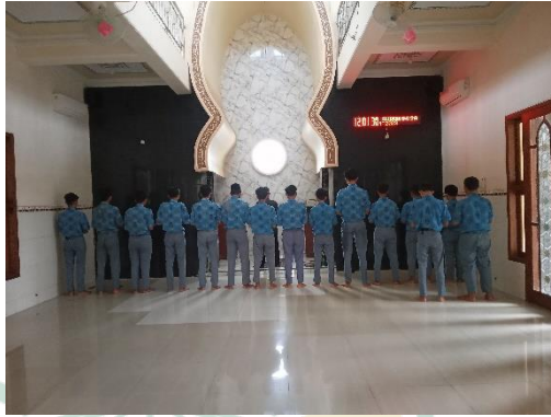
Gambar 4.5 Dokumentasi Pelaksanaan Salat Dhuhur Berjamaah

Masing-masing orang memiliki kepercayaan yang dianut sesuai ajarannya. Seperti pelaksanaan salat dhuhur berjamaah ini. Salat Dhuhur merupakan kewajiban bagi setiap muslim. Hanya saja pelaksanaannya dilakukan secara berjamaah. Dalam kaitannya hal ini, siswa non muslim yang ada di SMA Negeri 1 Welahan pun memiliki kewajiban sesuai agama yang dianutnya. Oleh karena itu, pihak sekolah membebaskan siswa non muslim untuk melaksanakan kewajiban sesuai agama yang dianutnya. 34