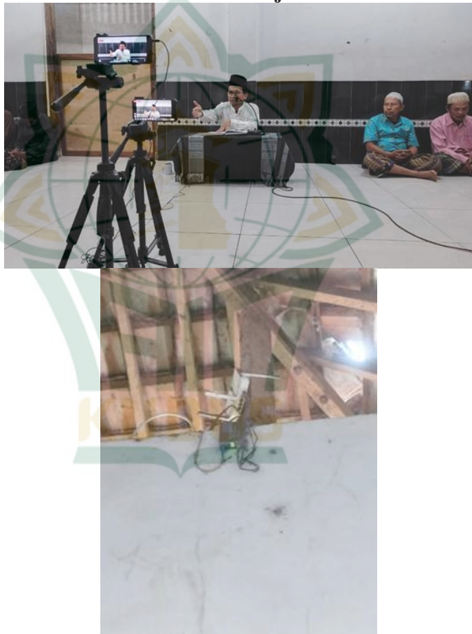
Gambar 4.3 Tampilan Alat Penunjang Dakwah Pondok Pesantren Mansajul Ulum

“Yang dimanfaatkan atau yang diperlukan dalam live streaming facebook ya yang pertama lewat alat ada tripod, ada HP yang digunakan, ada klip on buat suara supaya jernih, juga wifi internet buat live streaming itukan mesti ya itu yang kita perlukan.” 23