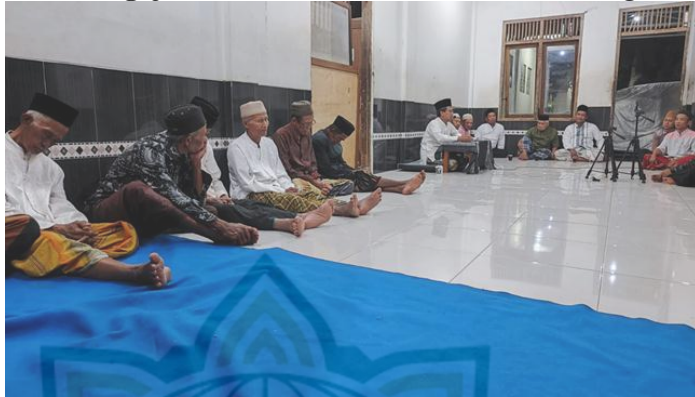
Gambar 4.4 Dokumentasi Masyarakat Umum Waktu Mengaji Offline dan Diiarkan Live streaming

Istiqomah merupakan salah satu cara bagaimana pengoptimalan manajemen media sosial yang dilakukan oleh Pondok Pesantren Mansajul Ulum. Dengan istiqomah , para penggemar ( muhibbin ) ini akan mengikuti terus. Sehingga setiap malam Rabu jam sekian, para muhibbin ini dapat mengikuti pengajian yang diadakan Pondok Pesantren Mansajul Ulum, baik untuk mengikuti secara offline atau online by video live streaming facebook .