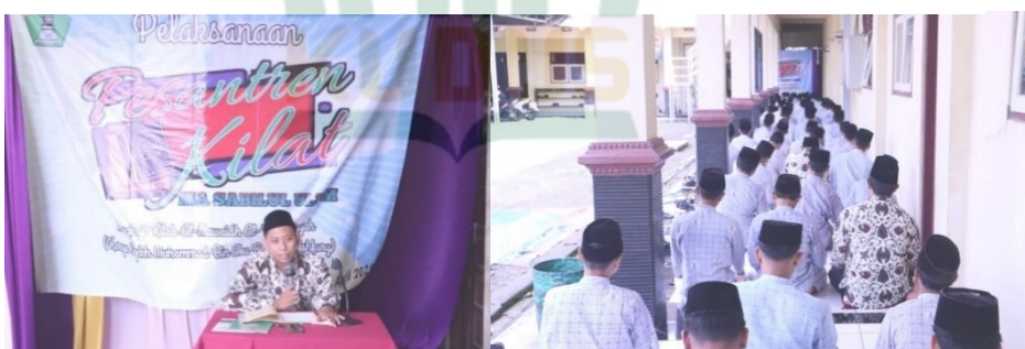
Gambar 4.6 Dokumentasi Pesantren Kilat

KBM ditiadakan karena diganti dengan kegiatan mengaji tadarus Al-Qur'an dan mengaji kitab kuning dengan model sorogan. 50 Model sorogan merupakan