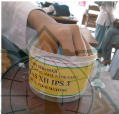
Gambar 4.3 Dokumentasi Senin Bersinar (Amal Rame-rame)

Kegiatan senin bersinar ini dilakukan oleh peserta didik dan digunakan untuk peserta didik atau keluarga peserta didik yang ketika mengalami suatu musibah berupa sakit atau meninggal dunia. Madrasah sengaja merencanakan program ini sebagai bentuk kepedulian terhadap sesama dan untuk mengajarkan para peserta didik untu selalu perduli dan saling membantu terhadap saudara kita yang sedang membutuhkan. Hal tersebut diperkuat dengan pernyataan Bapak Amin Sodiq selaku WAKA kesiswaan MA Sabilul Ulum.