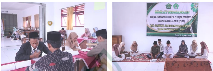
Gambar 4.7 Dokumentasi DIKLAT Keagamaan

Pelaksanaan pembelajaran dengan pendekatan kolaboratif dalam bentuk kelompok untuk mencapai tujuan bersama. Adapun tujuan dari adanya kegiatan DIKLAT keagamaan yaitu untuk membekali dan melatih mental peserta didik untuk mengimplementasikannya di masyarakat. Hal tersebut dijelaskan oleh Bapak Ainun Najib selaku waka kurikulum,