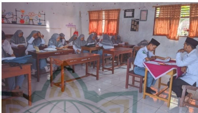
Gambar 4.5 Dokumentasi Imtihan Khususi

Dalam kegiatan IM'K ada beberapa penilaian yang dipakai yaitu meliputi; cara membacanya, murottal bacaannya, cara menjelaskan isi materi yang dibaca, dan tidak ada batasan minimal nilainya (KKM). Hal ini diperkuat dengan pernyataan dari Bapak M. Muslim selaku guru di MA Sabilul Ulum.