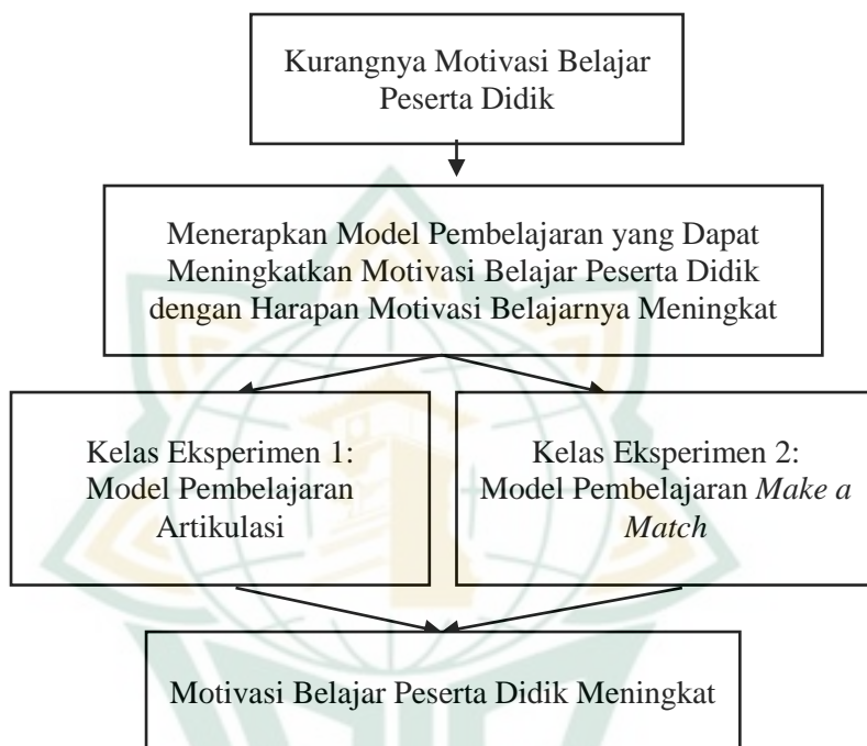
Tabel 2. 2 Kerangka Berpikir