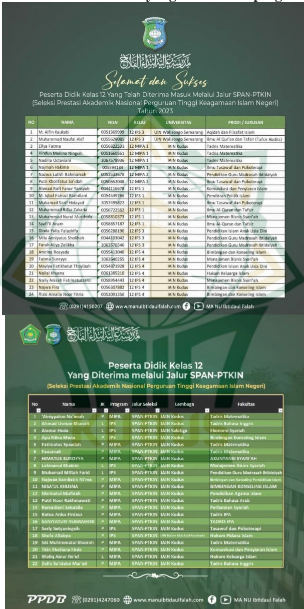
Gambar 4. 2 Jumlah siswa yang diterima di perguruan tinggi