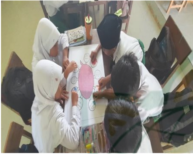
Gambar 4.12 Peserta didik Bekerjasama dengan Kelompoknya