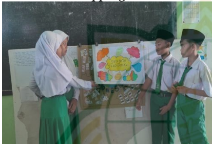
Gambar 4.15 Peserta Didik Mempresentasikan Hasil Mapping