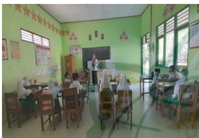
Gambar 4.9 Guru Menjelaskan Materi dan Langkah-langkah Pembelajaran