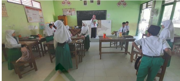
Gambar 4.6 Aktivitas Peserta Didik Mengatur Tempat Duduk

Dalam menyampaikan materi, guru harus memilih strategi yang tepat agar tujuan pembelajaran dapat tercapai dengan maksimal. Strategi yang dipilih oleh seorang guru harus disesuaikan dengan materi dan kondisi dari peserta didik. Sesuai penerapan kurikulum merdeka perlu dukungan dari tiga belah pihak yaitu, madrasah harus didukung oleh perangkat sarana dan prasarana yang memadai, peserta didik yang aktif dan guru yang dituntut untuk selalu berinovasi, berkeaktivitas dan berkompetensi dari aspek pedagogik, kepribadian sosial maupun professional, maka dari itulah guru mempunyai peran yang besar dalam mensukseskan suatu pembelajaran terutama dalam mata pelajaran ilmu pengetahuan alam dan sosial (IPAS).