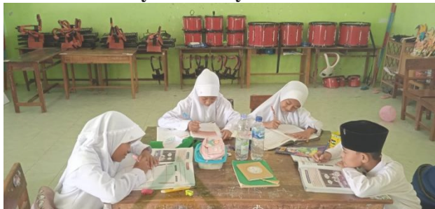
Gambar 4.11 Aktivitas Peserta Didik Mencatat Inti Materi Kekayaan Budaya Indonesia

Disambung dengan tanya jawab dengan soal-soal yang ada di buku selama penjelasan materi ajar berlangsung yang mana ini bertujuan agar pembelajaran di kelas menjadi aktif terutama peserta didik. Jadi guru memberi pertanyaan-pertanyaan stimulan selama proses pembelajaran berlangsung dan direspon peserta didik dengan menjawab pertanyaan yang diberikan oleh guru.