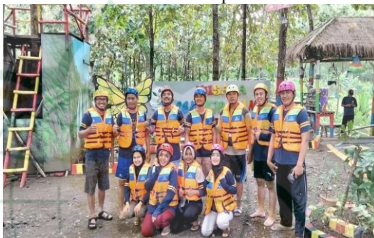
Gambar 4.3 PKunjungan Wisatawan Cengkir Manis Tanjungrejo

salah satu pemilik warung yang juga warga dari masyarakat Desa Tanjungrejo pada awal pembukaan Desa Wisata sangatlah ramai oleh pembeli sehingga penghasilan warung sehari-harinya juga banyak dan sudah cukup untuk memenuhi kebutuhan hidup sehari-hari.