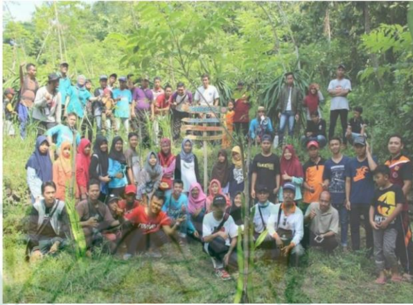
Gambar 4.1 sosialisasi terhadap masyarakat Desa Wisata Cengkir Manis Tanjungrejo 17

Bentuk Pemberdayaan Masyarakat dalam Peningkatan Perekonomian berbasis Pemanfaatan Desa Wisata di Desa Tanjungrejo ada beberapa bentuk yang sudah dilaksanakan oleh pengelolaan Desa Wisata di Tanjungrejo.