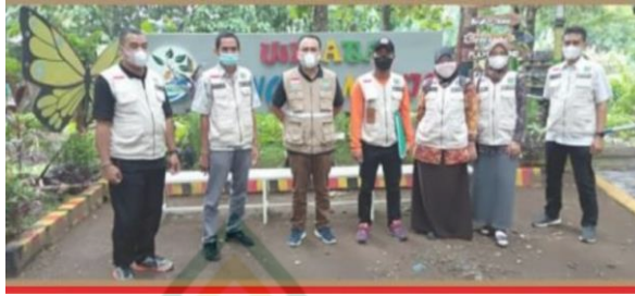
Gambar 4.2 Pelatihan Keselamatan dan Kesehatan Kerja Pengurus Wisata Cengkir Manis Tanjungrejo 21