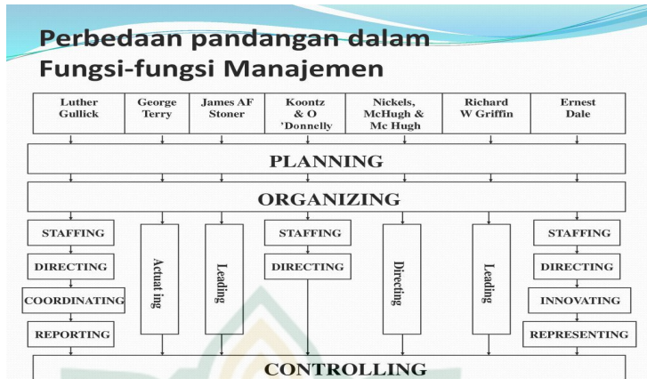
Gambar 2.1 Fungsi-fungsi Manajemen

Pendapat yang berbeda tentang fungsi manajemen. Ini dapat dengan mudah ditunjukkan dengan menyatakan pemikirannya berupa: 18