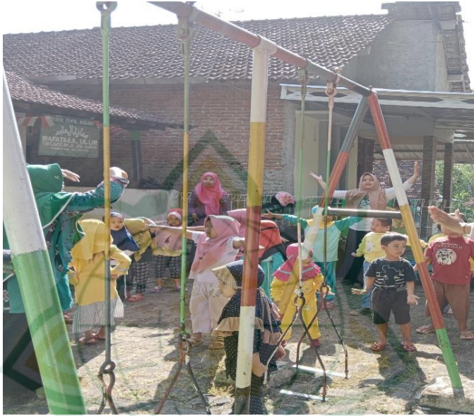
Gambar 4. 3 Kondisi tempat bermain di RA Mafatihul Ulum

Dari hasil pengamatan peneliti, kondisi lembaga RA Mafatihul Ulum gurunya telah menyediakan tempat bermain untuk anak yang nyaman dan aman. Sehingga anak dapat belajar dan bermain dengan baik.