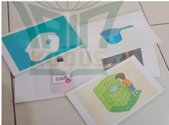
Gambar 4. 4 Pengenalan Peralatan Toilet

Pada kegiatan kartu gambar peralatan beserta langkah-langkah ditoilet, anak mampu menebak benda apa, fungsinya dan langkah-langkah BAK/BAB. Pembelajaran menggunakan media gambar ini tentunya akan membantu anak mengetahui bentuk benda apa yang kegunaannya dan langkah-langkah