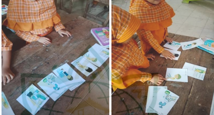
Gambar 4. 6 Flash Card Mengurutkan Langkah-langkah dan Adab BAK/BAB

Dalam kegiatan toilet training menggunakan media Flash card ini anak disuruh untuk mengurutkan langkah-langkah beserta adab ajaran islam mulai dari membaca doa masuk toilet kemudian masuk menggunakan kaki kiri, melepas celana, duduk/jongkot di kloset, menyiram/mencet tombol flesh, mencuci tangan dengan sabun, memakai celana, keluar toilet menggunakan kaki kanan dan berdoa. Dengan kegiatan ini akan membantu anak dalam mengetahui langkah-langkah yang benar.