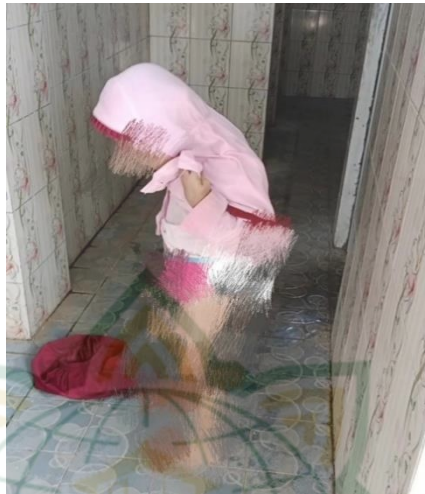
Gambar 4.7 Praktik

Kegiatan selanjutnya adalah praktik toilet training , pada saat praktik berlangsung anak-anak RA Mafatihul Ulum sudah mampu melakukan BAK/BAB yang benar, anak sudah mampu melepas dan memakai celana sendiri tanpa bantuan, mencuci tangan menggunakan sabun, dan anak sudah bisa menghafalkan doa masuk keluar toilet. Namun juga ada anak yang masih kesulitan memakai celana dikarenakan celana tersebut berangkap dua. Hasil penelitian ini anak sudah bisa dikata mandiri karena peneliti telah melihat dan membuktikan bahwa peserta didik sudah mampu melakukan BAK/BAB sendiri dengan benar.