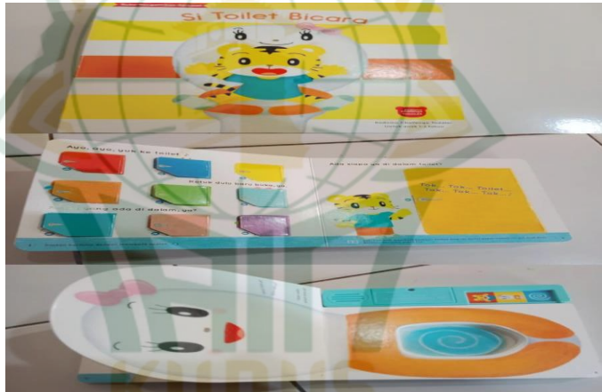
Gambar 4. 5 Sound book toilet training (si toilet bicara)

Media yang kedua merupakan sound book toilet training , media diatas merupakan buku bersuara yang menceritakan si kucing belajar toilet training . Buku tersebut berisi langkah-langkah BAK/BAB. Ketika anak melihat media tersebut, pembelajaran sangat berjalan dengan baik. Mungkin karena adanya media yang baru sehingga anak tertarik. Sound book itu terdapat lagu yang mengajak anak untuk pergi ke toilet. Didalam buku ada gambar pintu yang bisa dibuka yang di dalamnya ada kucing melepas celaca, membuka pintu dan ada gajah sedang menyiram jamban dll. Media tersebut menyebutkan langkah-langkah yang harus dilakukan pada saat ingin BAK/BAB dengan benar. Dengan adanya media sound