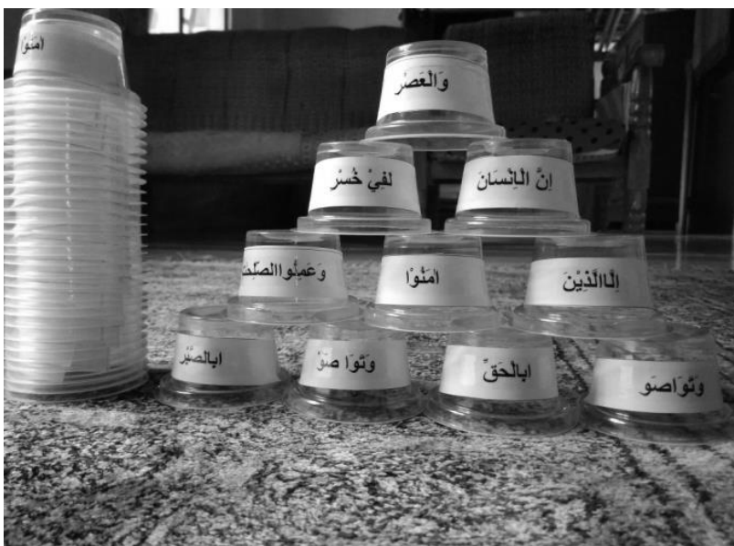
Variasi model pembelajaran Menara Puzzles, antara lain :