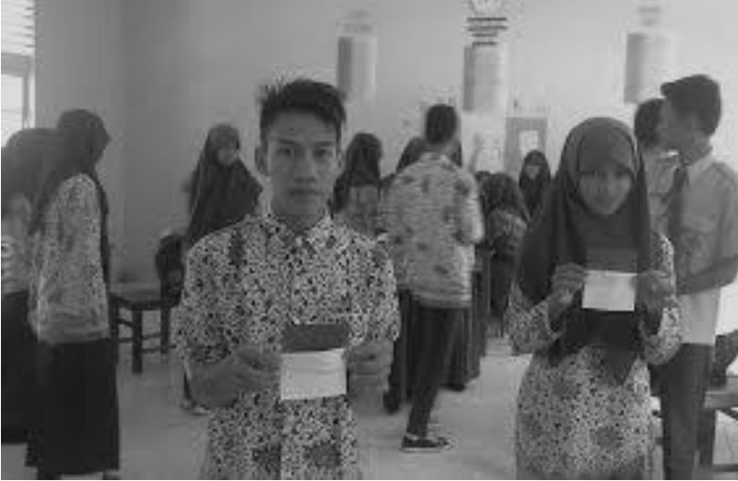
Contoh Metode Index Card Match