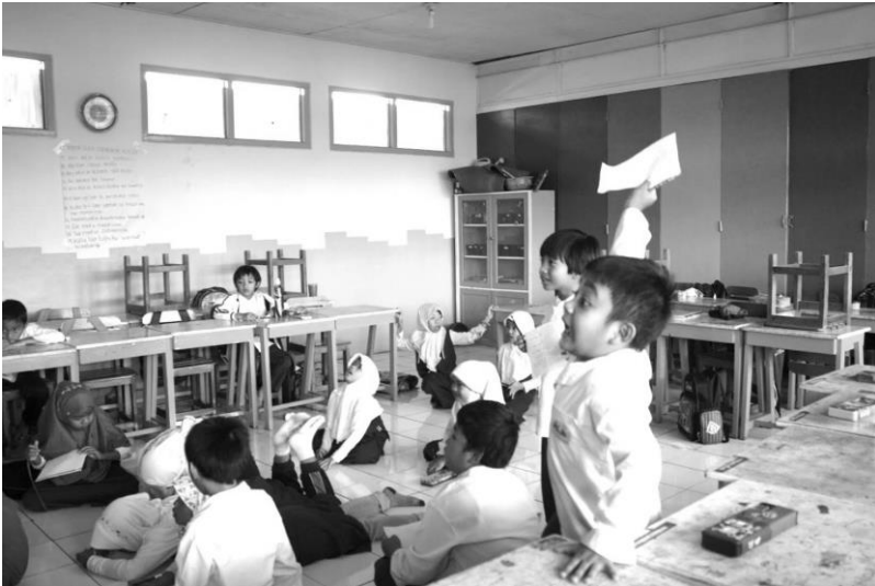
Contoh kegiatan pembelajaran dengan metode Questions Student Have

Variasi strategi pembelajaran Questions Student Have (Pertanyaan dari Siswa) dengan tidak menuliskan pertanyaan, tetapi mintalah peserta didik menuliskan harapan atau perhatian mereka terhadap pelajaran yang dipelajari. Diharapkan setelah peserta didik menuliskan harapannya guru dapat mengetahui dan bisa memperbaiki pembelajaran.