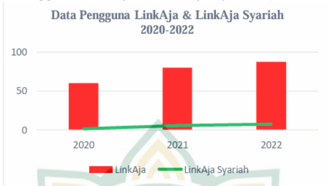
Gambar 2 Data Pengguna LinkAja & LinkAja Syariah (2020-2022) 10