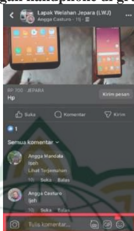
Gambar 4.4 Postingan handphone di grup LWJ