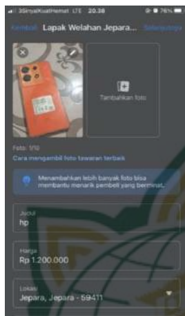
Gambar 4.5 Cara memposting di grup