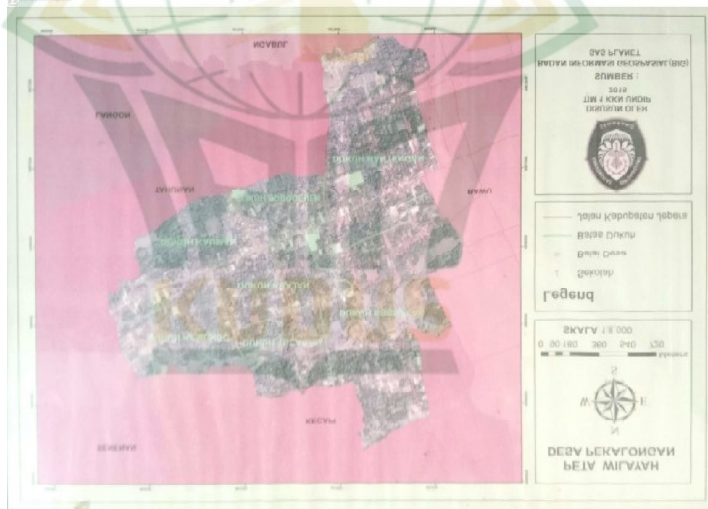
Gambar 4.1 Peta Desa Pekalongan