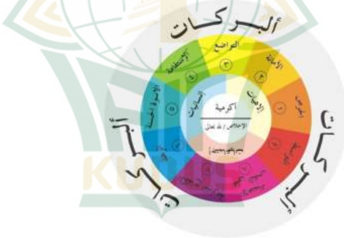
Gambar 4.2 Nilai Dasar Shalih Akram. 56

memiliki implikasi praktis, serta satu nilai tambahan sebagai penyelesaian. "Sembilan" merujuk pada Sembilan nilai yang terus diinternalsiasikan dalam pendidikan di IPMAFA Pati dan Lembaga lain yang terafiliasi. Sembilan nilai tersebut mencakup: rasa ingin tahu ( hirs ), kepercayaan (amanah), kerendahan hati ( tawadu ), disiplin ( istiqamah ), teladan yang baik ( uswah hasanah ), ketakmewahan ( zuhud ), semangat perjuangan ( kifah mudawamah ), kemandirian ( i'timad ala al-nafs ), dan moderasi ( tasawut ). Sementara itu, "satu" merujuk pada satu nilai yang disebut sebagai barokat, yang memiliki sifat abstrak dan melengkapi kesembilan nilai sebelumnya agar dapat diwujudkan secara penuh. 55 Gambar diagram Nilai Dasar Shalih Akhram sebagaimana berikut: