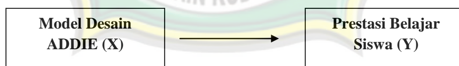
Gambar 2.2 Kerangka Berfikir

Uma Sekaran dalam bukunya Business Research mengemukakan bahwa, kerangka berfikir merupakan model konseptual tentang bagaimana teori berhubungan dengan berbagai faktor yang telah diidentifikasi sebagai masalah yang penting. 50 Dalam penelitian ini, diketahui ada dua variabel, independen dan dependen. Satu variabel independen adalah model ADDIE , sedangkan variabel dependen adalah prestasi belajar siswa kelas VI dalam mata pelajaran fiqih. Dalam penelitian ini model yang diketengahkan adalah: